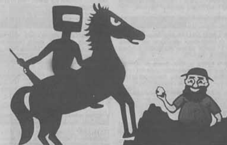
GENIAL. Teatro de Sombras de Richard Bradshaw. / FITM

Hace miles de años, en una cueva, junto al fuego recién conquistado, un hombre se puso a fabular y al mover sus manos aparecieron sobre las paredes de la caverna monstruos y cazadores, sombras saltarinas, lanzas certeras, grandes bocas amenazantes, oscuros oráculos... Aquel arte efímero quizá fue el comienzo del teatro. Las manos de aquel hombre abrieron la puerta de la representación y del misterio. Hay